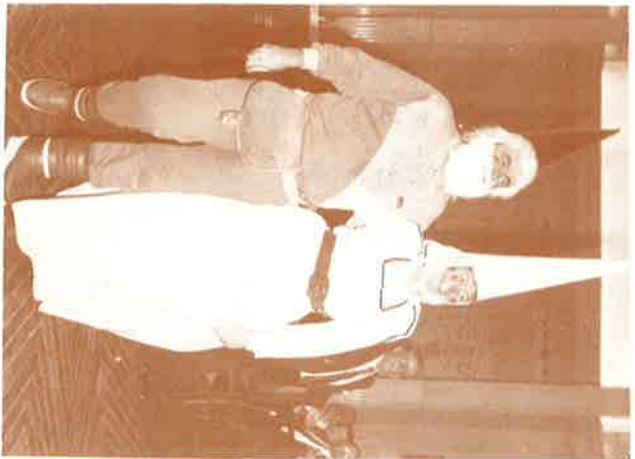
Vedlos: hermosos, sanos, coloradotes... ¡Que gozada este par de giganteses!